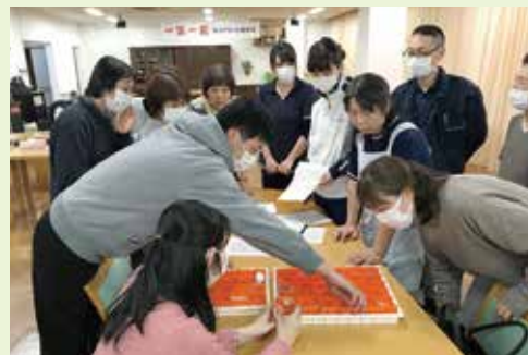
服薬間違いがないように、名前と顔をしっかりと確認し、服薬支援を行います