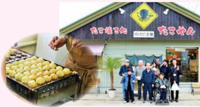
アツアツのたこ焼き、おいしかったです!!