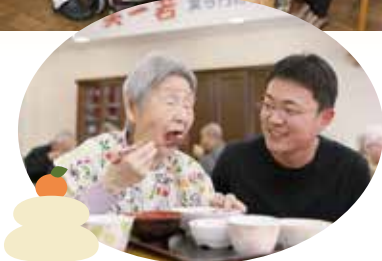
つきたてのお餅は美味しいね〜