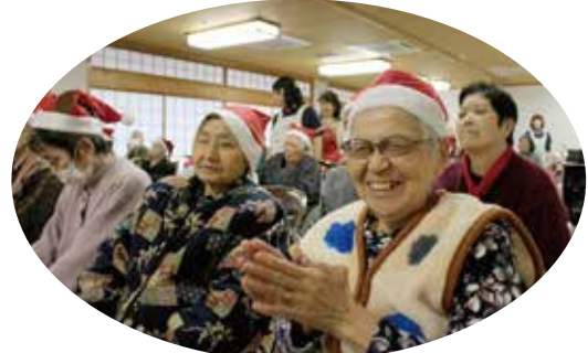
サンタクロースの帽子のプレゼント ありがとうございました