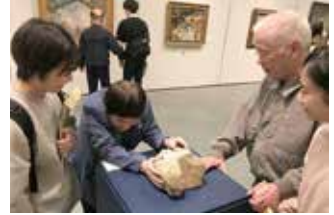
ふれて楽しむ美術展に行ってきました

新潟医療福祉大学医療技術学部視機能科学科3年生(15名)が10月7日～11月15日の間、1～4期に分かれて実習を行いました。 実習では、利用者の皆さんとの関わりを通して、高齢視覚障がい者に対する具体的な配慮や支援方法などを学びました。 実習生からは「はじめは高齢視覚障がい者の方々との接し方に不安がありました。が、実習を通してコミュニケーション技術や情報提供、支援方法などを学ぶことができました。今後の臨床実習や将来視能訓練士として患者さんと関わる時には、一人ひとりに合わせた話し方や声のトーンなどを意識し、【表情のある声】で接することができるように頑張りたいです」と話されていました。