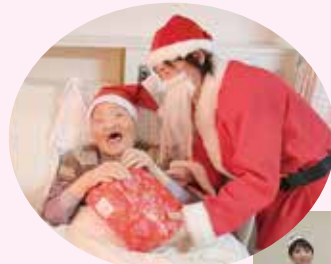
プレゼント どうぞ