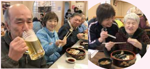
外出は楽しいですね