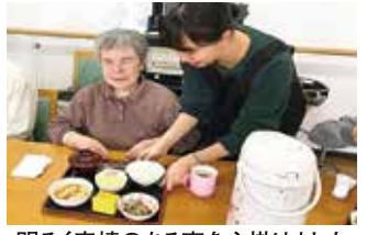
明るく表情のある声を心掛けました

新潟医療福祉大学医療技術学部視機能科学科3年生(15名)が10月7日～11月15日の間、1～4期に分かれて実習を行いました。 実習では、利用者の皆さんとの関わりを通して、高齢視覚障がい者に対する具体的な配慮や支援方法などを学びました。 実習生からは「はじめは高齢視覚障がい者の方々との接し方に不安がありました。が、実習を通してコミュニケーション技術や情報提供、支援方法などを学ぶことができました。今後の臨床実習や将来視能訓練士として患者さんと関わる時には、一人ひとりに合わせた話し方や声のトーンなどを意識し、【表情のある声】で接することができるように頑張りたいです」と話されていました。