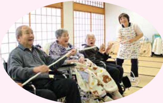
つな送りゲーム楽しいね