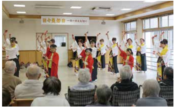
力強く息の合った踊り、ありがとうございました