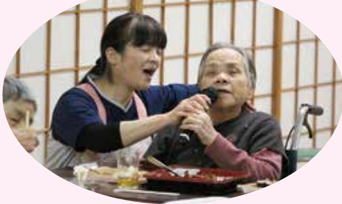
職員と一緒に一曲