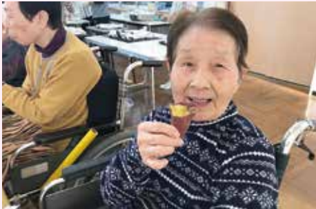
甘くておいしいよ!