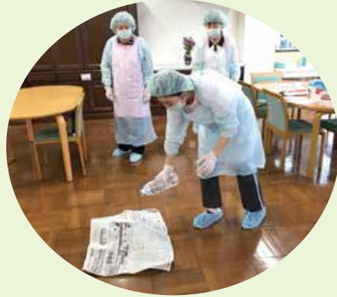
感染症予防研修では嘔吐物の処理方法について学びました

皆さんは千支と十二支の違いをご存じですか。今年の千支は？と聞かれると、多くの人は「子(ねずみ)」と答えます。私もそうでした。「子」は十二支であり、千支ではありません。中国の五行思想から発生した考え方の十干(じっかん)「甲・乙・丙・丁・戊・己・庚・辛・壬・癸」と十二支(じゅうにし)「子・丑・寅・卯・辰・巳・午・未・申・酉・戌・亥」を組み合わせたものが「千支」です。十干の千(かん)と、十二支の支(し)で千支(えと・かんし)という成り立ちです。十干があまり使われなくなってきたため、近年では千支といえは十二支を指すことが多くなつたといわれています。 十干の十種類と十二支の十二種類を順番に組み合わせると六十種類(六十年分)となり、千支が一週して還ってくることを「還暦」と呼びます。六十歳になると再び自分が生まれた年の千支を経験し、その節目に長寿を祈念し、還暦として祝うようになったそうです。二〇二〇年の千支は、六十番中三十七番目の、庚子(かのえね)。新しいことにチャレンジするのに適した年だそうです。 私たち施設職員も、利用者の皆さんや地域の方々に喜んでいただけるよう、新たな取り組みを思案していきたく思いますので、本年もどうぞよろしくお願ひ申し上げます。