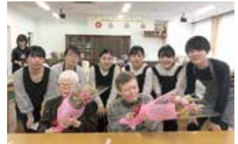
誕生者と一緒記念撮影