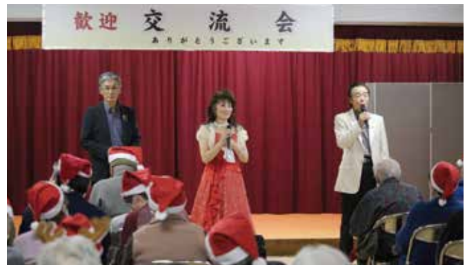
とても歌が上手くて聞きごたえがありました