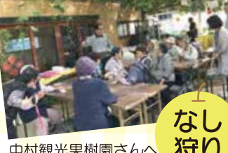
中村観光果樹園さんへ (新潟市南区)