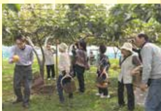
大きくて甘い「梨」でしたよ！

10月9日には、地域の皆さんと「なし狩りツアー」に出かけ、楽しいひと時を過ごしました。