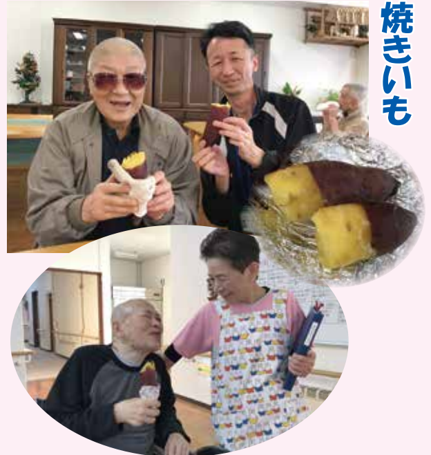
やすらぎの家で作った「焼きいも」 おいしいよね!!