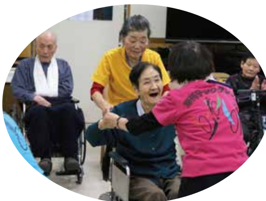
車椅子でも楽しく踊ることができました