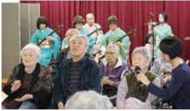
利用者の皆さんや地域の皆さんは「新潟笹団子節」や「北国の春」を歌い楽しみました♪