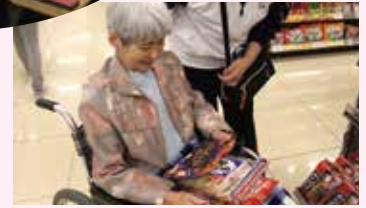
このチョコがいがしら