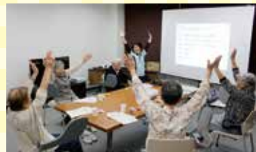
健康いきいき体操