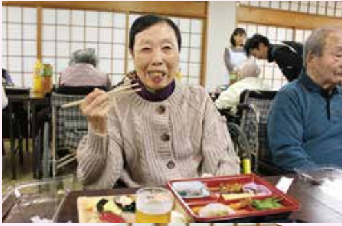
とってもおいしいわ