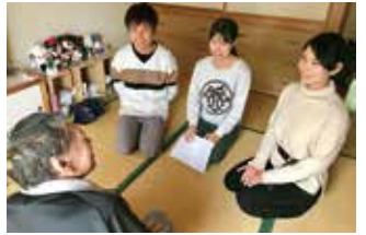
居室を訪問し楽しくお話ししました