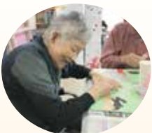
亀はこの位置かなあ

本年度も利用者の皆さんと日本昔話をテーマに作品を作りました。利用者の皆さんも聞いたことのある日本昔話で会話も盛り上がり、楽しく作品作りをする事が出来ました。