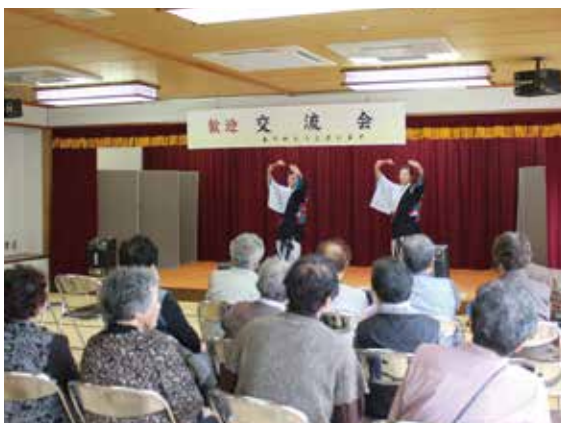
懐かしい歌や息の合った踊りの披露、 ありがとうございました