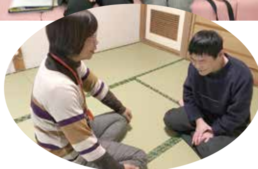
話を聞いてもらえてすっきりしました