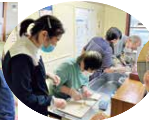
調理室でみそ汁作りです