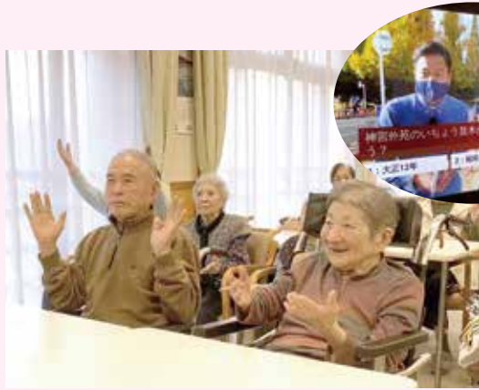
観光した気分になりました！