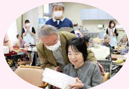
おめでとうございます(*^-^)/★