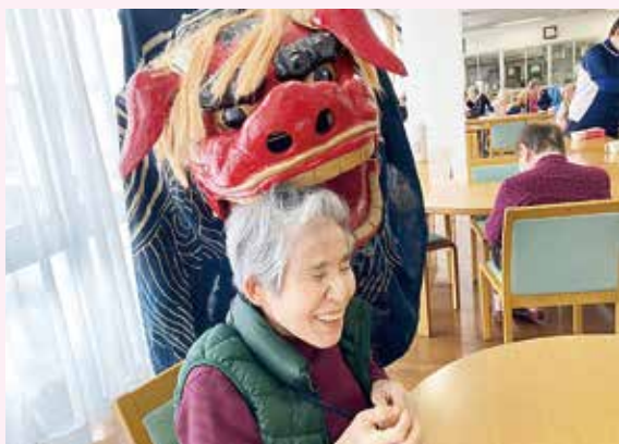
獅子舞に噛まれた～!!