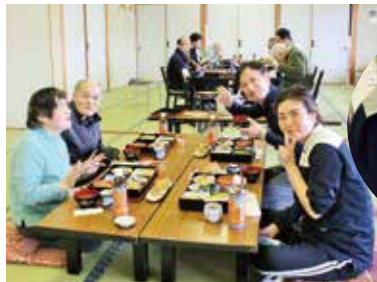
久しぶりのバスハイキング楽しいですね