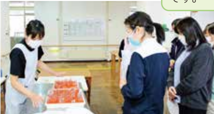
配薬方法の確認や誤薬を防ぐための取り組みについて、説明と実践を通して学びました