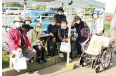
久しぶりに皆さんと外出を楽しみました