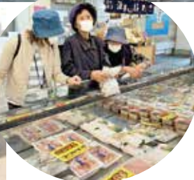
どれにしようかね～