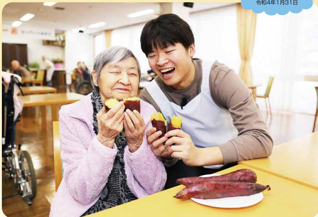
「焼きいも大好き～」と微笑む利用者さん

〒959-2823 新潟県胎内市熱田坂881-86 TEL(0254)48-3134・3135 FAX(0254)48-3969 http://www.tainai-yasuragi.com/