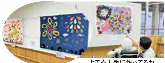
とても上手に作ってるね