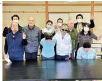
菱風荘さんありがとうございました