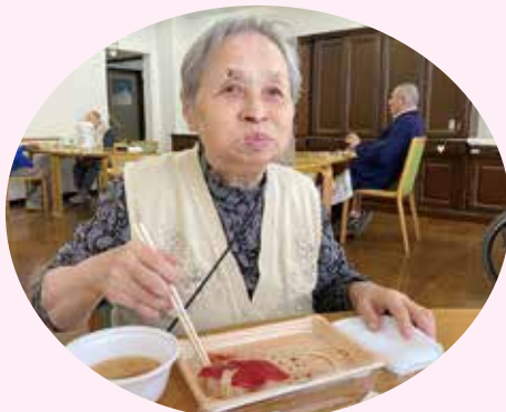
口の中いっぱいのお寿司、幸せです♪