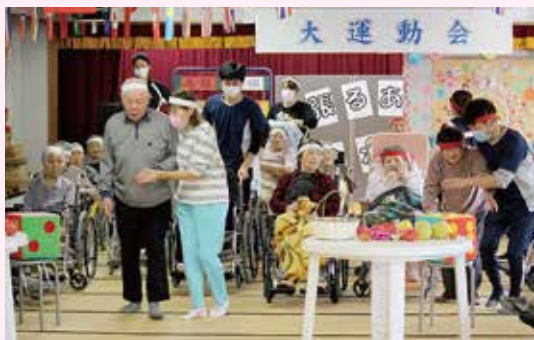
大いに盛り上がった運動会でした!