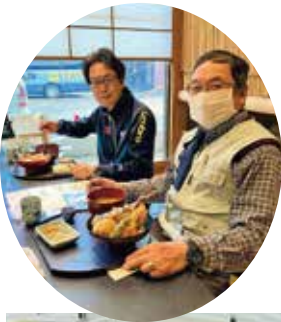
石地わさび園さんで記念撮影