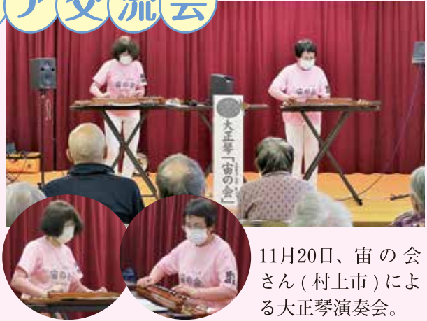
11月20日、宙の会さん(村上市)による大正琴演奏会。

対面によるボランティア交流会を開催しました。利用者の皆さんは「久しぶりにボランティアさんが来所してくれて楽しめたよ」、「また来てほしいね」とボランティアさんとの交流を楽しんでいました。ボランティアの皆さんありがとうございました。