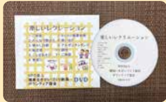
NPO法人健康生きがづくり新潟さんから「楽しいレクリエーションDVD」を寄贈いただきました