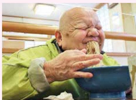
寒い日のラーメンは最高だな♪