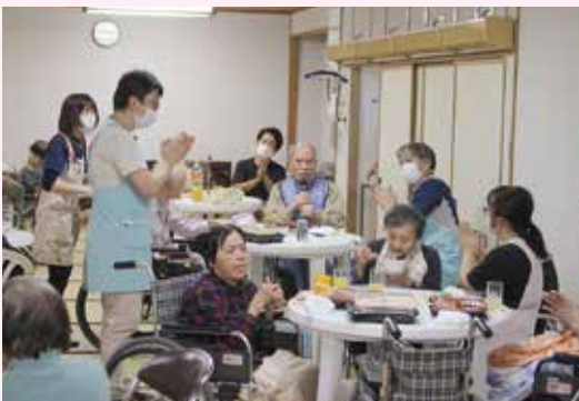
食べて、飲んで、唄って、楽しかったです♪