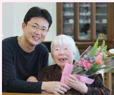
おめでとうございます(*^-^)/★