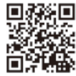
カレイドスクエアパーク胎内さんホームページ

特別養護老人ホーム第二胎内やすらぎの家ロビーに、カレイドスクエアパーク胎内さんの子供達が創作した作品を展示しています。今後も継続して作品を展示させていただきます。