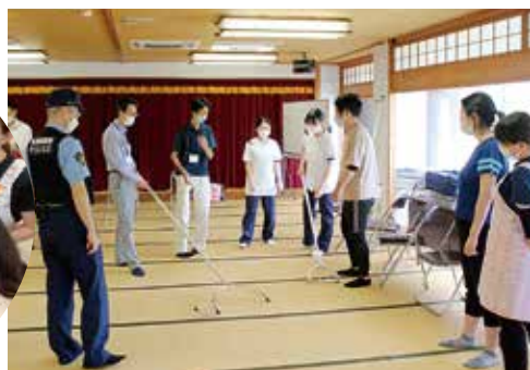
警察の方にさすまたの使い方を教えていただきました