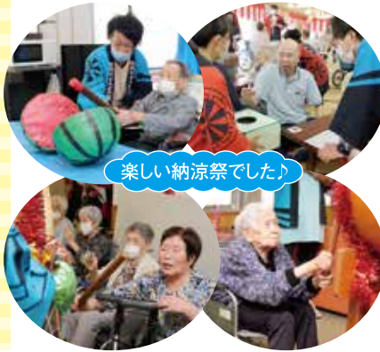
楽しい納涼祭でした♪

3年ぶりに東京学館新潟高等学校インターアクトクラブの皆さんがボランティアに来所され、お神輿を担いでくれたり、飲食ブースやくじ引きのお手伝いをしてくださいました。ありがとうございました。