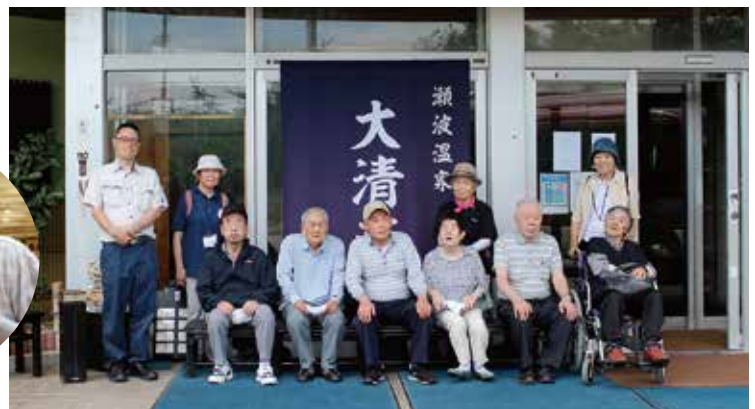
利用者さん、ボランティアさん、スタッフで記念撮影