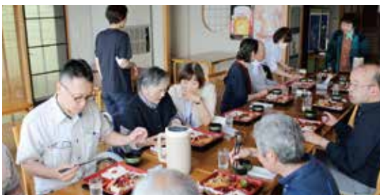
瀬波温泉 大清荘での昼食

7月6日、養護盲老人ホーム「胎内やすらぎの家」の利用者さんが、夕日の美しさや波の音を聞きながら日本海の幸を楽しめる瀬波温泉(村上市)に出かけました。利用者の皆さんは「足湯」に入ったり、美味しい料理を食べ「久しぶりに外出して、ゆつくりできてよかった」、「料理が美味しいね」、「買物ができて楽しかった」と久しぶりのバスハイキングを楽しんでいました。