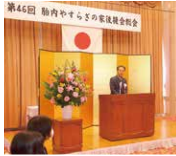
胎内市長 井畑後援会長の挨拶