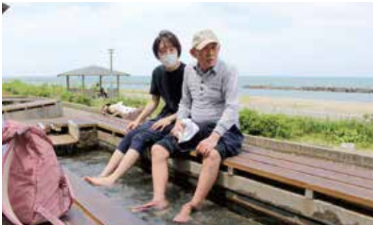
足湯「日本海」で足湯を楽しみました