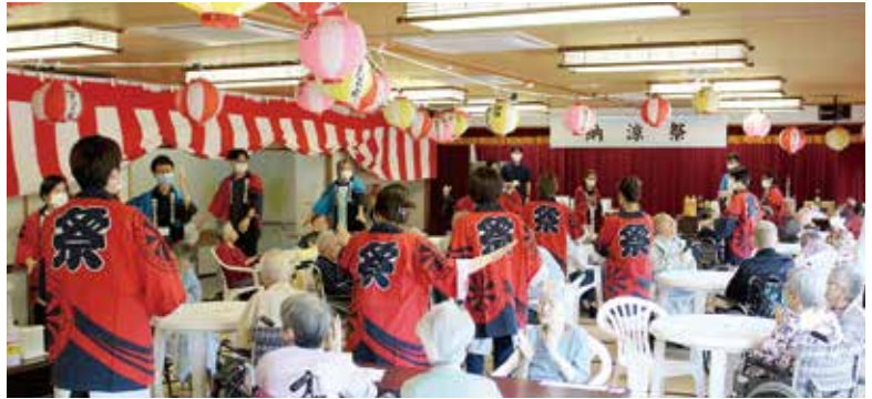
職員と利用者さんが一緒に「佐渡おけさ」を踊りました