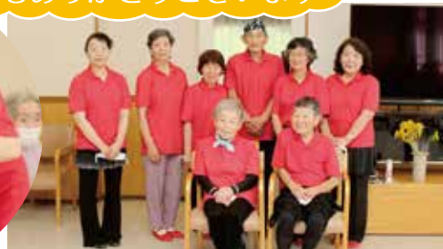
車イスなかよし会の皆さん

胎内やすらぎの家で のボランティア活動 をご希望の方は施設ま でご連絡ください。 (☎ 0254-48-3134)