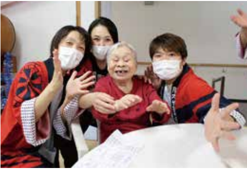
賑やかで楽しい納涼祭でした♪