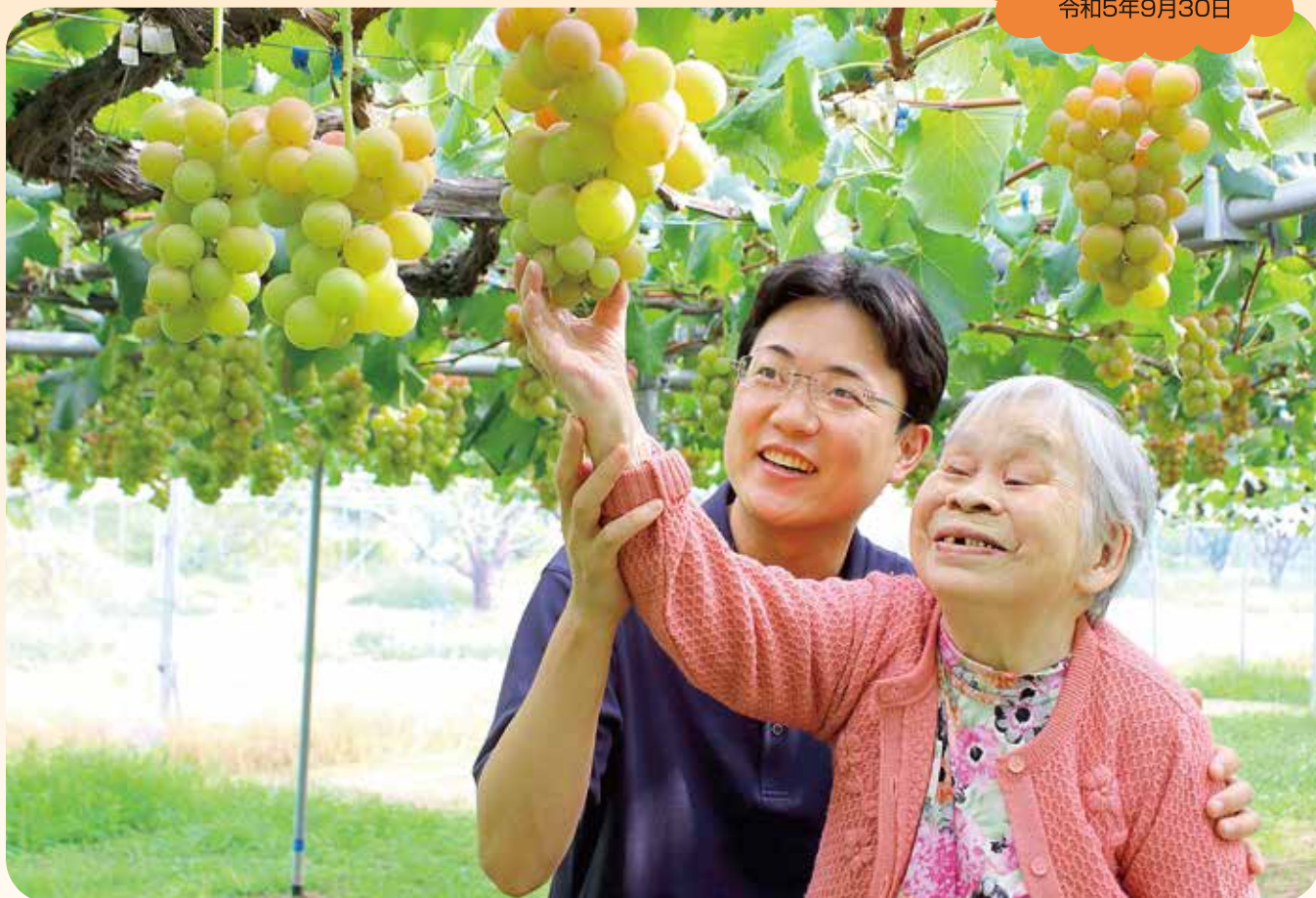
たわわに実ったぶどうに触れ微笑む利用者さん(聖籠町：坂上ぶどう園)

〒959-2823 新潟県胎内市熱田坂881-86 TEL(0254)48-3134・3135 FAX(0254)48-3969 http://www.tainai-yasuragi.com/