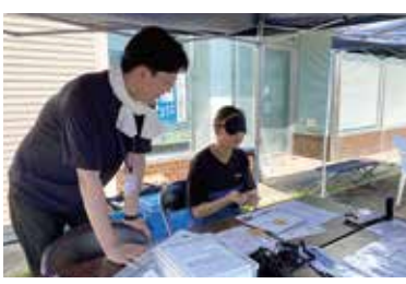
ロービジョン(弱視)体験!! 迷路やパズルをしています